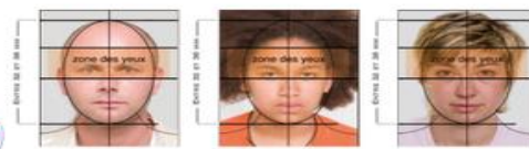
CONFORME À LA NORME ISO/IEC 19794-5 : 2005